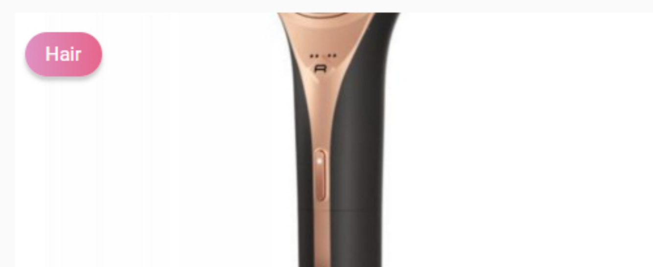
Hair Therapist, la nuova spazzola a vapore di Rowenta